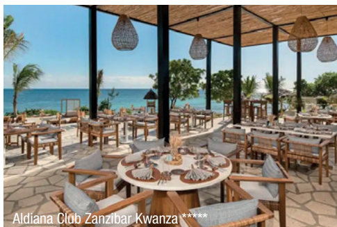
Aldiana Club Zanzibar Kwanza *****