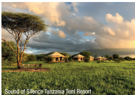
Sound of Silence Tanzania Tent Resort

Hinflug, 20./21.01.2026/Di, Mi: 22.00 Uhr ab Wien – 06.20 Uhr an Addis Abeba, 10.35 Uhr ab Addis Abeba – 12.55 Uhr an Kilimanjaro Rückflug, 29./30.01.2026/Do, Fr: 17.00 Uhr ab Sansibar – 19.35 Uhr an Addis Abeba, 01.30 Uhr ab Addis Abeba – 06.05 an Wien