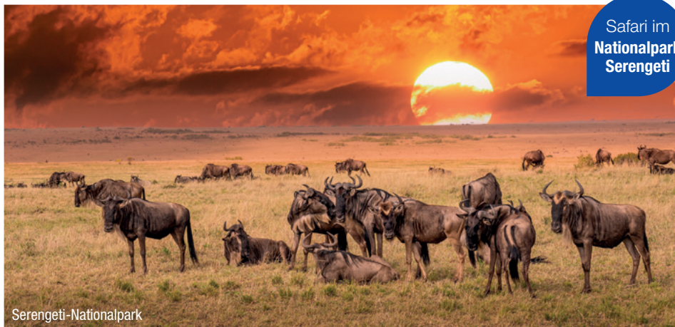
Safari im Nationalpark Serengeti