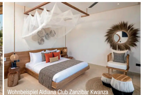
Wohnbeispiel Aldiana Club Zanzibar Kwanza

Preis-, Termin- und Programmänderungen vorbehalten.