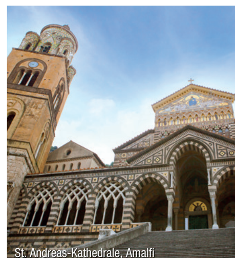
St. Andreas-Kathedrale, Amalfi

Hinweis: Alle Ausflüge in englischer Sprache.