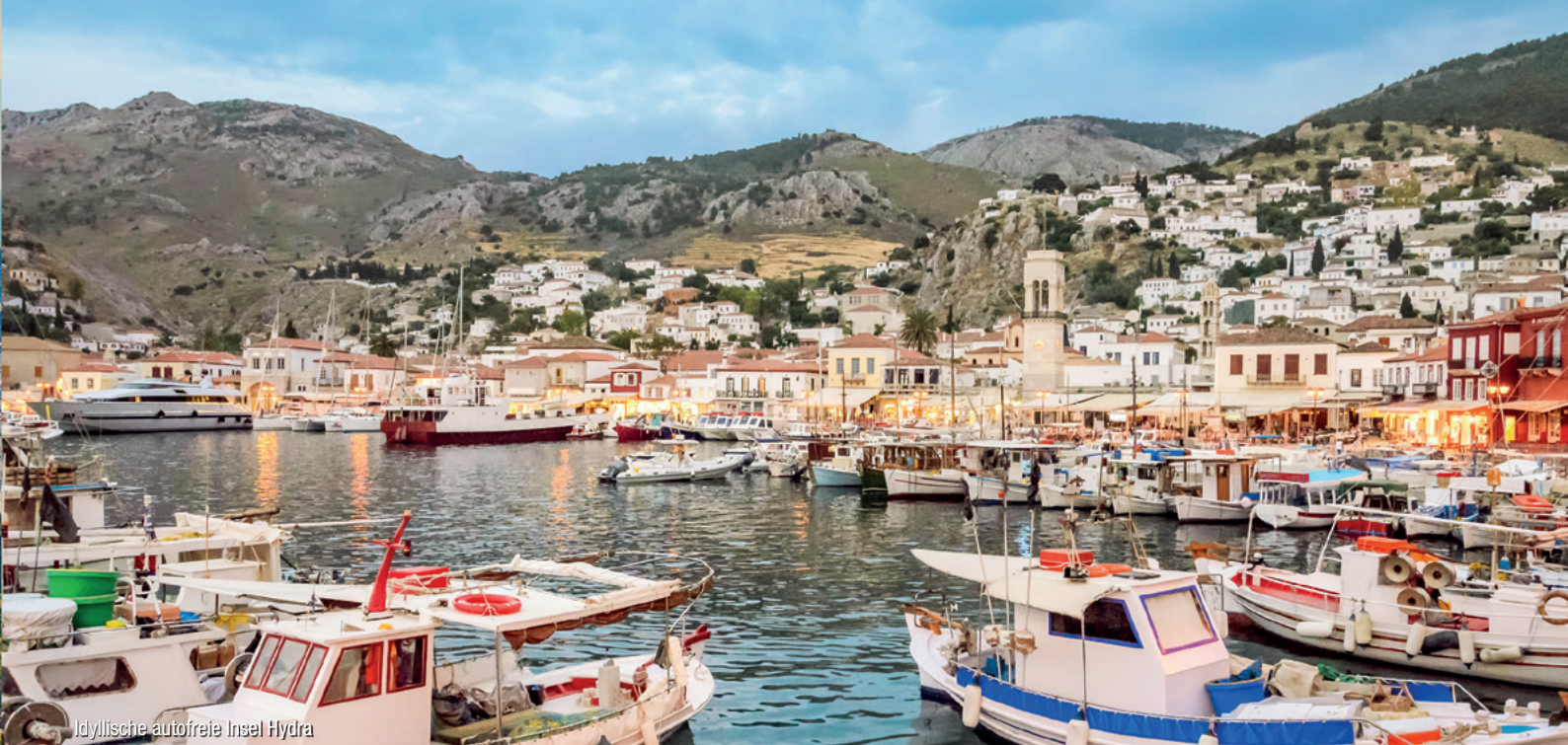
Idyllische autofreie Insel Hydra