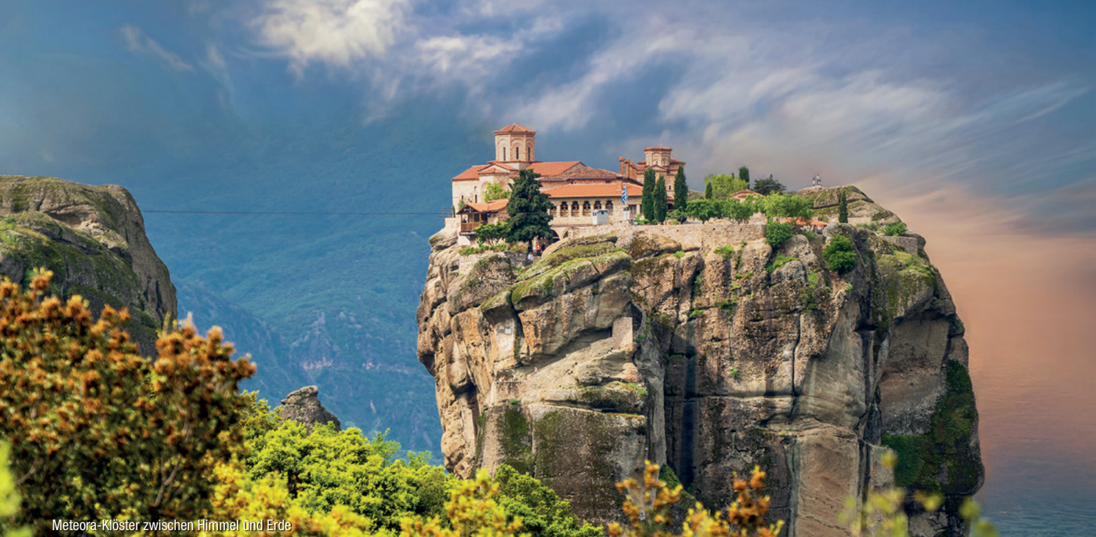
Meteora-Klöster zwischen Himmel und Erde