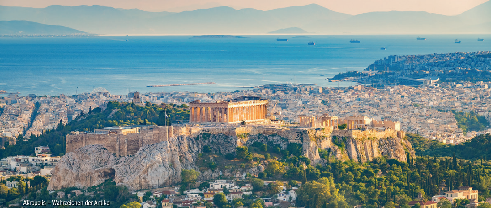
Akropolis – Wahrzeichen der Antike