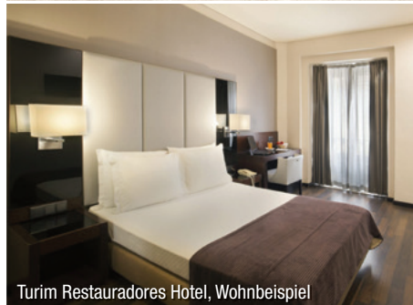
Turim Restauradores Hotel, Wohnbeispiel