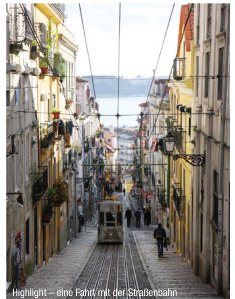
Highlight – eine Fahrt mit der Straßenbahn

14.15 Uhr ab Lissabon – 18.10 Uhr an Venedig