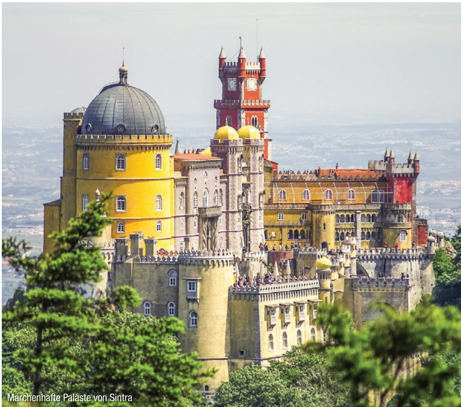
Märchenhafte Paläste von Sintra