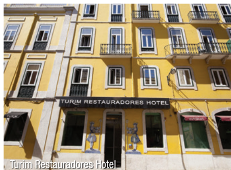
Turim Restauradores Hotel

Dieses geschichtsträchtige Hotel, direkt neben dem Elevador da Glória gelegen, wurde 2010 einer Komplettrenovierung unterzogen. Von außen hat das Hotel den historischen Stil beibehalten und mit einem modernen und gewagten Inneren ausgestattet. Das Hotel umfasst 97 Zimmer, von denen Sie oben das Schloss von S. Jorge sehen können. Das Hotel ist mit einem Restaurant, einer Bar, einem Cafe, einem Leseraum und mit WLAN ausgestattet.