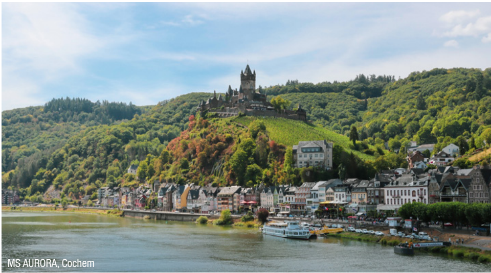
MS AURORA, Cochem