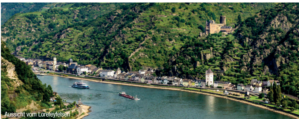
Aussicht vom Loreleyfelsen