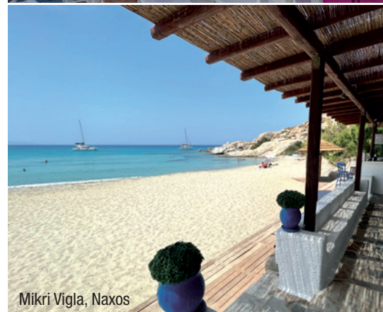
Mikri Vigla, Naxos