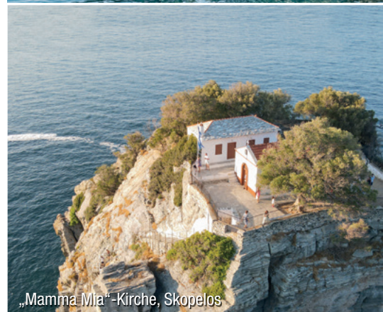
„Mamma Mia“-Kirche, Skopelos