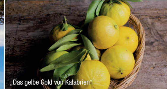
„Das gelbe Gold von Kalabrien“