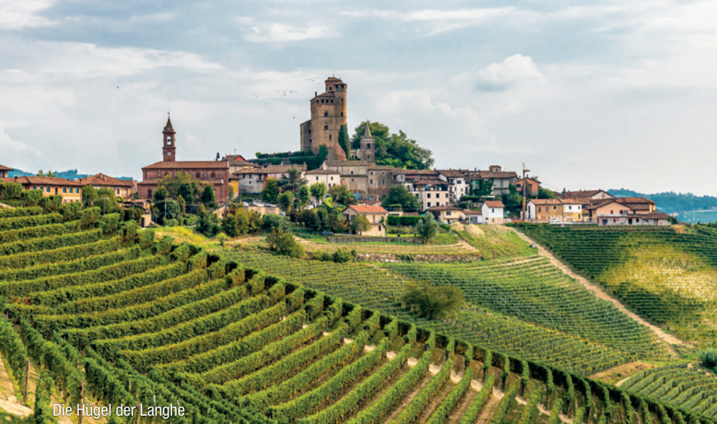
Die Hügel der Langhe