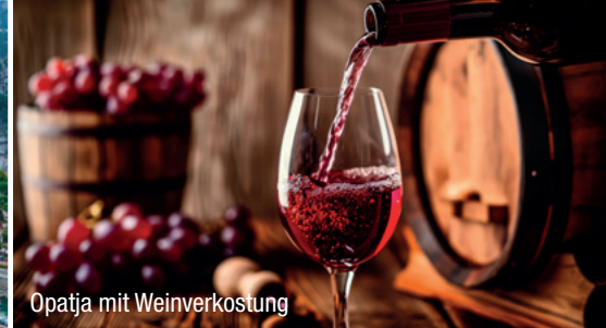
Opatja mit Weinverkostung