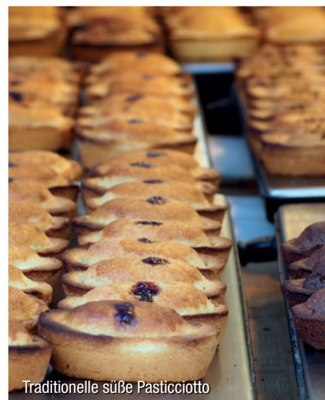
Traditionelle süße Pasticcio