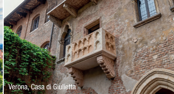
Verona, Casa di Julietta