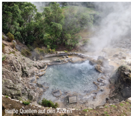
Heiße Quellen auf den Azoren

Frühstück im Hotel und Check-Out bis 11.00 Uhr. Zeit zur freien Verfügung bis ca. 11.00 Uhr, um die Gegend auf eigene Faust zu erkunden. Transfer zum Flughafen und Rückflug nach Wien.