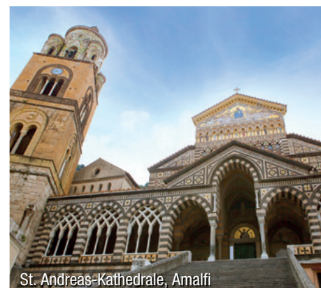
St. Andreas-Kathedrale, Amalfi

würdigkeiten haben schon seit jeher Besucher aus aller Welt angezogen. Nach einer Panoramarundfahrt Transfer zum Flughafen und Rückflug nach Graz.