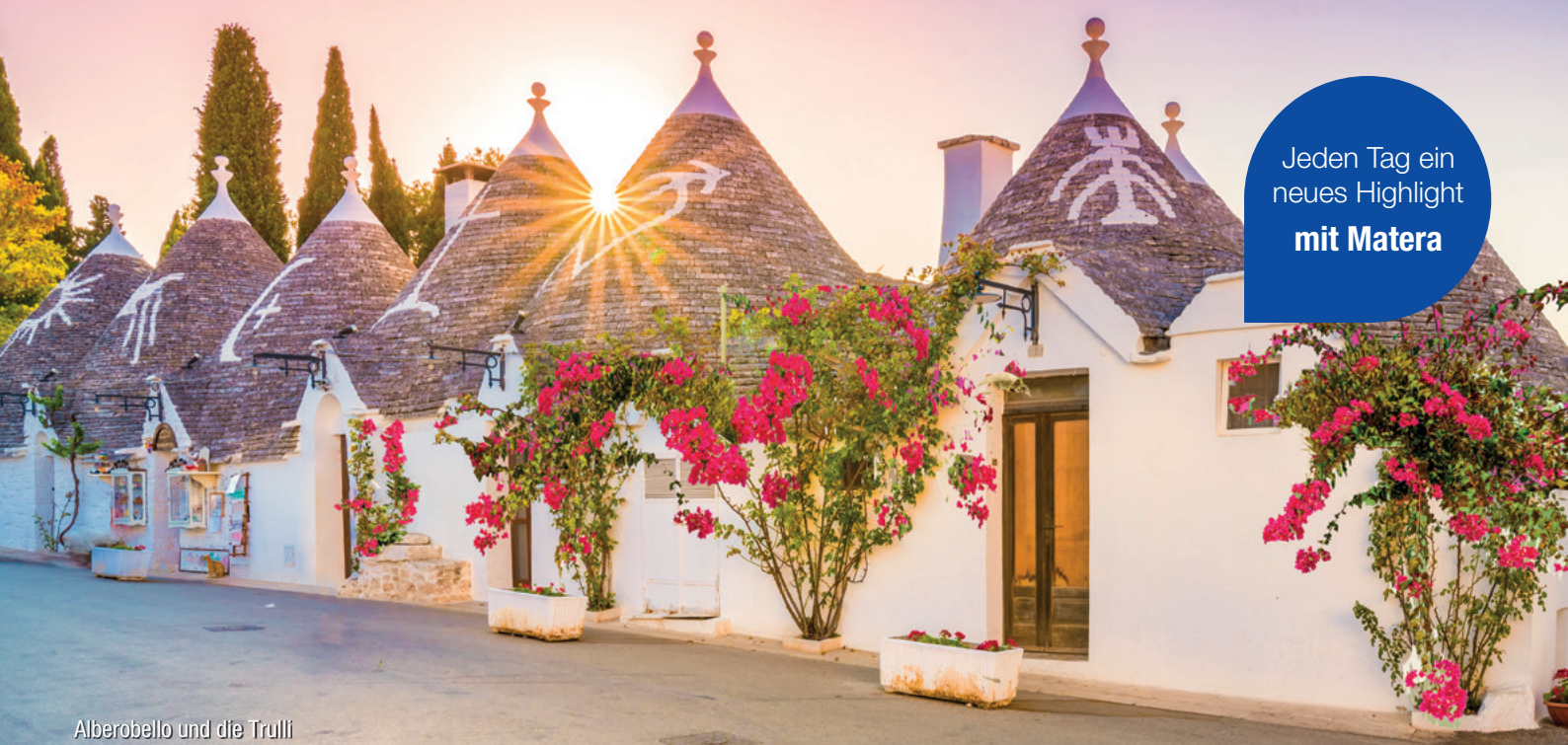
Alberobello und die Trulli

Jeden Tag ein neues Highlight mit Matera