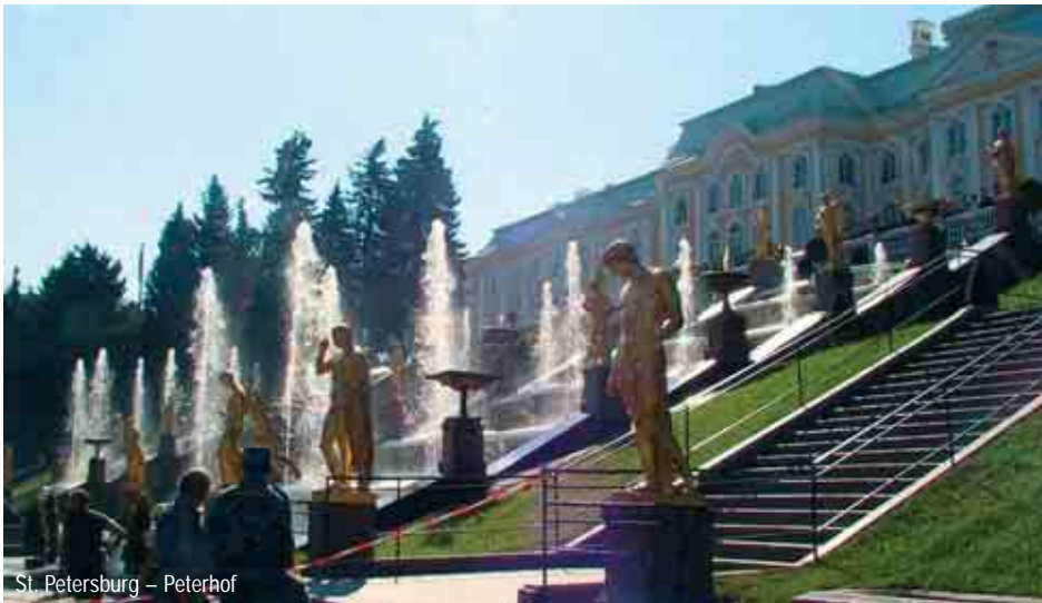
St. Petersburg – Peterhof