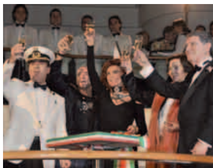
Schiffstaufe in Hamburg mit Sophia Loren und Eros Ramazzotti

Die MSC Magnifica wartet auf 13 Decks mit viel Messing, warmen Tönen und vielen Lichtakzenten. Erstmals gibt es auch einen zweiten Swimmingpool, der auch überdacht werden kann. Platz bietet das Luxussschiff für mehr als 2.500 Passagiere, die aus 13 Bars, 5 Restaurants und einem chinesischen Restaurant wählen können. Der Wellness-Bereich lässt ebenfalls keine Wünsche offen. Neben exotischen Einrichtungen gibt es zwei Saunen, zwei türkische Bäder sowie Hydrotherapie, Aromatherapie oder Chromotherapie.